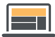
Billboard 970 x 250 px