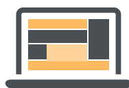
FloorAd 100% breed x 80 px expand to 600 x 400 px + Leaderboard 728 x 90 px